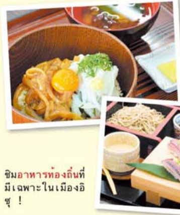
ชิมอาหารท้องถิ่นที่ มีเฉพาะในเมืองอิ ซุ!