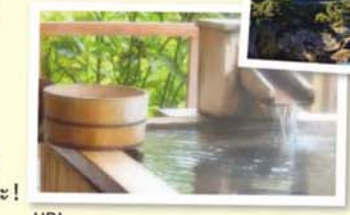
เพลิดเพลินกับการแช่ออนเซ็น ที่มีอยู่ทุกพื้นที่!

คอร์สท่องเที่ยวที่แนะนำของรถโดยสารโทโคได้เปิดตัวแล้ว!