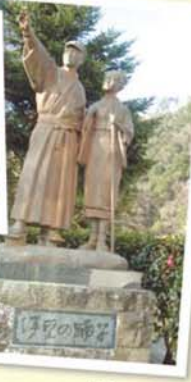
สัมผัสวรรณกรรมสมัยใหม่ที่มากมายและ ประวัติศาสตร์การเปิดประเทศที่ซิมิโตะ!