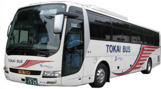
高速乗合バス「伊豆長岡・修善寺温泉ライナー」

高速乗合バス「伊豆長岡・修善寺温泉ライナー」の往復乗車券を購入された方は、修善寺駅⇄西伊豆間の路線バスの往復乗車券を特別割引でご購入いただけます。首都圏から西伊豆へお出かけの際はぜひご利用ください。