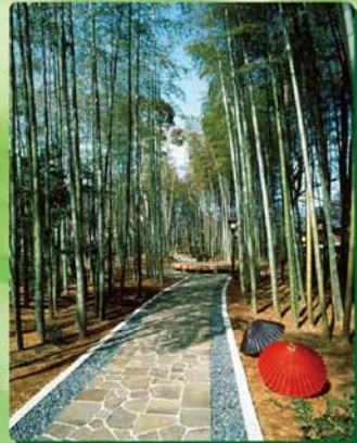
竹林の小径(最寄バス停:修善寺温泉)