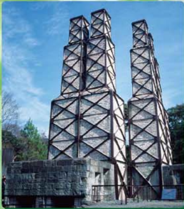
世界文化遺産・韮山反射炉(最寄バス停:長岡温泉)