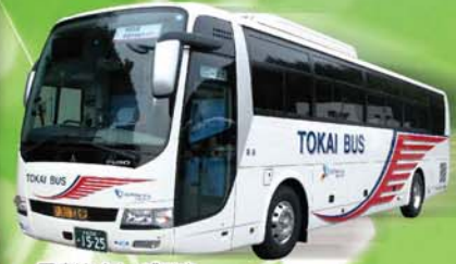
写真はイメージです 安全のためシートベルトをお締めください。