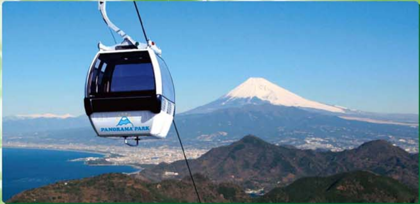
伊豆の国パノラマパーク(最寄バス停:長岡温泉)