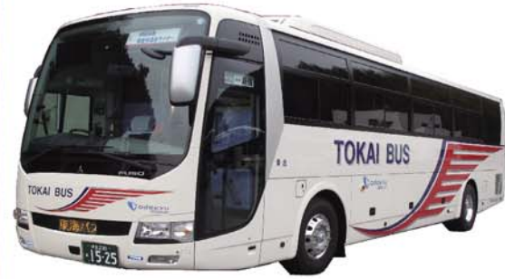
高速乗合バス「伊豆長岡・修善寺温泉ライナー」

高速乗合バス「伊豆長岡・修善寺温泉ライナー」の往復乗車券を購入された方は、修善寺駅⇄西伊豆間の路線バスの往復乗車券を特別割引でご購入いただけます。首都圏から西伊豆へお出かけの際はぜひご利用ください。