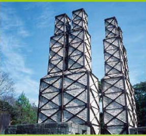
世界文化遺産 葦山反射炉 (最寄バス停:長岡温泉) 長岡温泉バス停からはその他の交通機関をご利用ください。