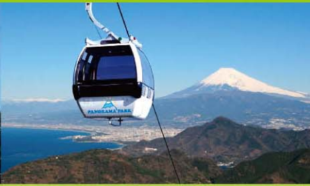
伊豆の国パノラマパーク (最寄バス停:長岡温泉) 空中公園からは「富士山・駿河湾」の絶景が一望