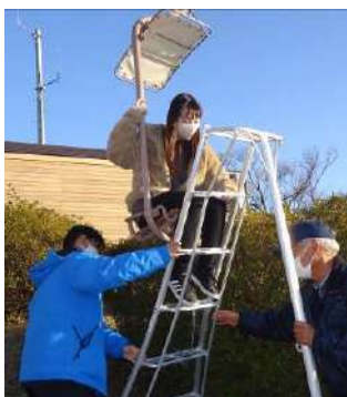
・女性客を想定した救助訓練

本社管理部門立会いのもと、索道係員一同にて緊急事態発生を想定した救助訓練および情報伝達訓練をそれぞれ年1回実施しました。また、緊急事態発生時における措置系統について、索道係員が迅速かつ的確に対応できるよう、役割の再確認をしました。