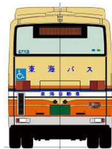
[復刻デザイン路線バスのイラスト]

つきましては2022年11月16日（水）10:00～11:00の間、東海自動車株式会社（伊東市渚町2-28）にて当該車両の展示披露を行いますのでご案内申し上げます。