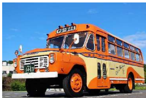
ボンネットバス「伊豆の踊子号」

現行の標準カラーはオレンジとイエローの2色をメインに使用していますが、復刻デザインでは当時、実際に使用していたカラーでの塗装はもちろんのこと、“乗降口ドアやホイールもボディ色”とし、“東海自動車のロゴ”、“日野自動車の立体エンブレム”を採用するなど、再現度を高めています。これにより、先日、大規模なリニューアルを行ったボンネットバス「伊豆の踊子号」にも通ずるカラーイメージとなっております。