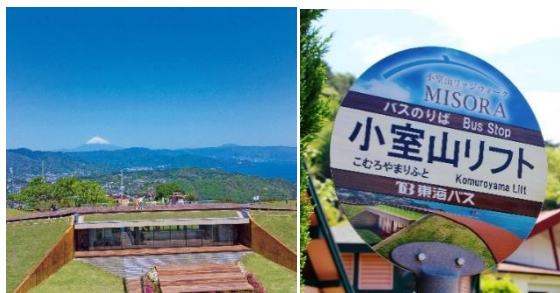
小室山リッジウォーク“MISORA”

当路線を利用することで、「小室山リッジウォーク“MISORA”」と「大室山」や「伊豆シャボテン動物公園」など伊東市内の人気観光地が、乗り換えなくアクセスできます。