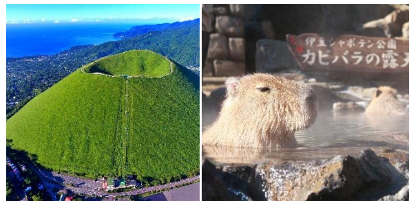
大室山・伊豆シャボテン動物公園

「小室山リフト」バス停と「シャボテン公園」バス停を結ぶ路線の増便についての概要は、下記のとおりです。