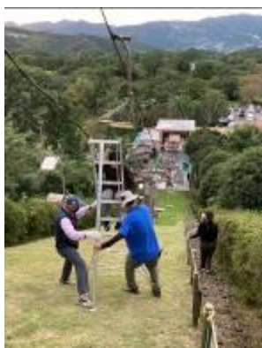
・救助訓練の様子

本社管理部門立会いのもと、索道係員一同および隣接する事業所スタッフにて緊急事態発生を想定した救助訓練ならびに情報伝達訓練を実施しました。また、緊急事態発生時における措置系統について、索道係員が迅速かつ的確に対応できるよう、役割の再確認をしました。