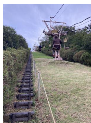
・避難用階段整備工事