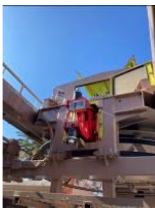
・常用 非常制動機 更新

安全の維持・向上のため、設備改修工事の5ヵ年計画を策定し、計画に基づき改修工事等を実施しています。2022年度は常用・非常用制動機更新工事および避難用階段の整備工事を実施しました。