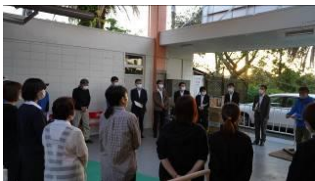
・実施後反省会の様子