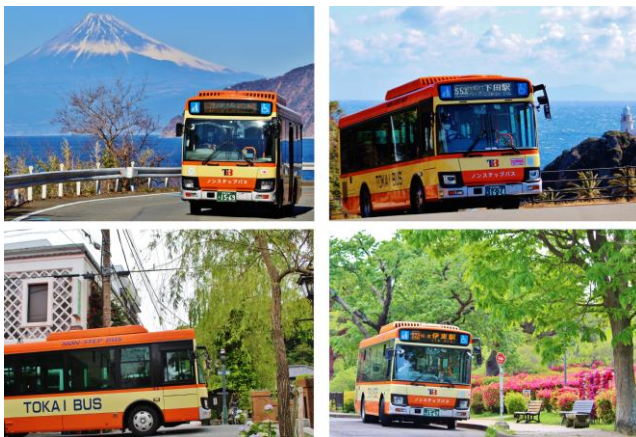
フリーきっぷで巡る伊豆半島エリア

当社は、観光型 MaaS の推進及び子育て世代・外国人観光客にも利用しやすいサービスを提供することで、より多くのお客さまに選ばれる路線バスを目指してまいります。