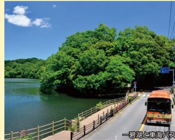
一碧湖と東海バス