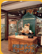
伊豆ディベアミュージアム