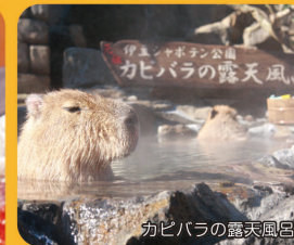
カピバラの露天風呂