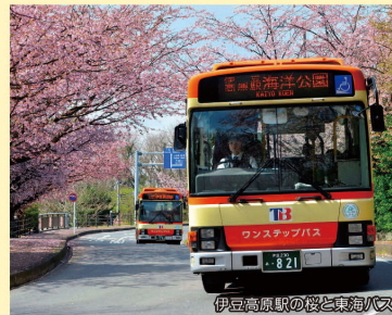
伊豆高原駅の傍と東海バス